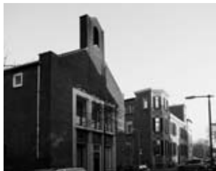
Voormalige hersteld Apostolische Zendingsgemeente