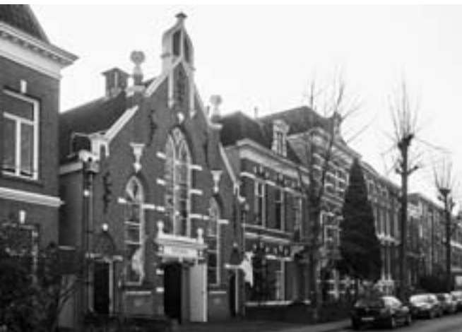
Voormalige kerk Apostolische gemeente