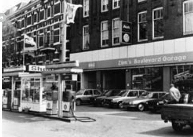
Zijm omstreeks 1985