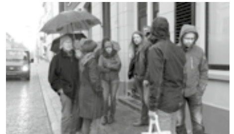
Aan het einde van de Spijkerstraat