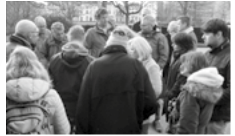
Voor café Vrijdag

Op www.mijnspijkerkwartier.nl zal steeds de laatste informatie te lezen zijn en kunnen bewoners ook reageren. ●