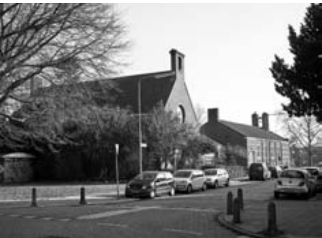
Gereformeerde gemeente (voorgond) en de Chinees Christelijke Gemeente Nederland (achtergrond)