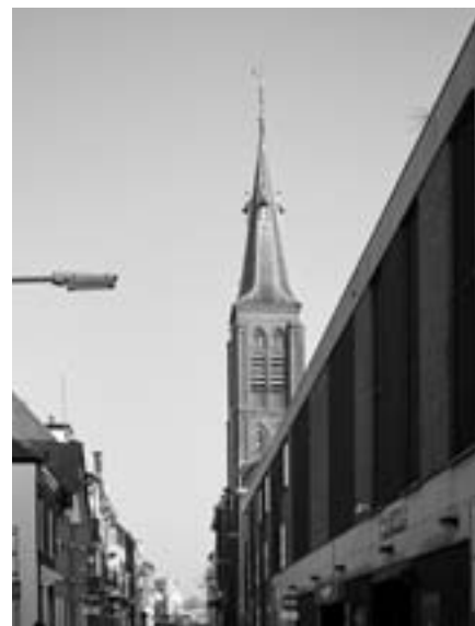
Evangelisch Lutherse Kerk (voorzijde)