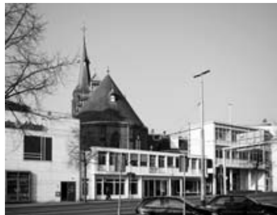
Evangelisch Lutherse Kerk (achterzijde)