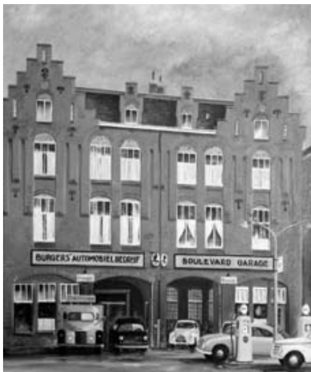
Zijm in de jaren '50

Meer dan vijftig jaar geleden begon Zijm als Simca dealer. Later kwam het accent te liggen op de merken uit de Volkswagen groep. Begin dit jaar heeft Zijm aangekondigd dat de Boulevard Garage in april 2015 verhuist naar Merwedestraat 1. Het is nog niet duidelijk wat er met het pand aan de Boulevard Heuvelink gaat gebeuren. De garage is al in 2009 verkocht aan een projectontwikkelaar, maar die kreeg telkens geen goedkeuring voor zijn plannen om er, bijv. een parkeerterrein te bouwen. ●