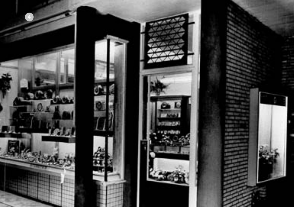
Opening van de zaak in 1953