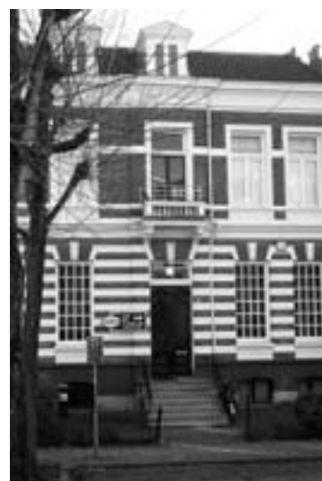
Kerk der zevendedags-adventisten