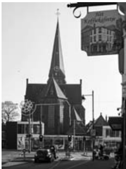
Martinuskerk vanaf de Hommelseweg