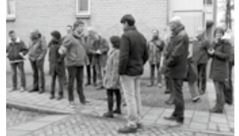
Hoek Spijkerstraat en Boekhorstenstraat