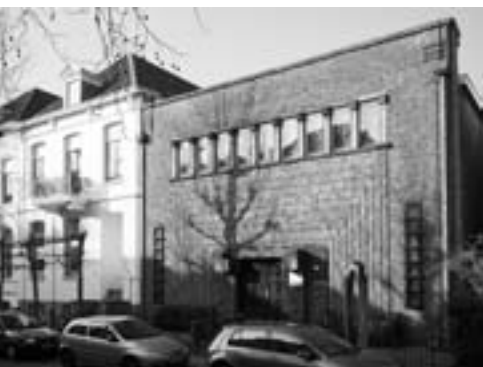
Vrijzinnig hervormde kerk