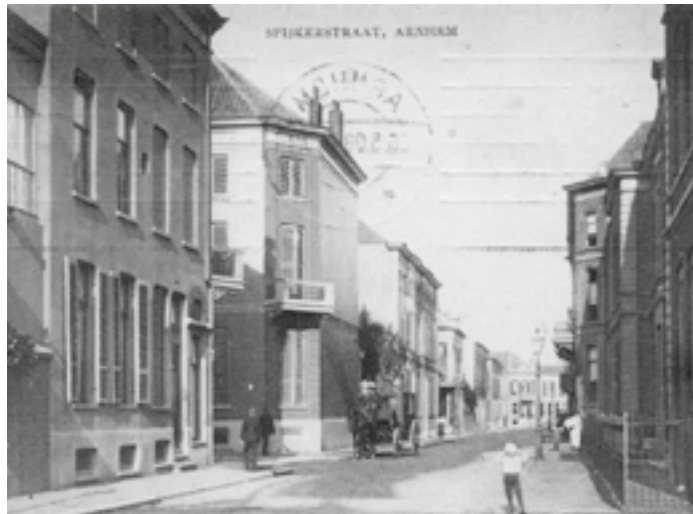
foto 1909, volgens de poststempel die er doorheen komt

Tot 1935 stond aan de rechterkant het Protestants Bestedelingenhuis. In dat jaar moest het pand grotendeels wijken om plaats te maken voor de huidige portiekwoningen aan de School- en de Spijkerstraat (bron www.arnhem.nl ). Een bestedeling is iemand die wordt uitbesteed. Dat wil zeggen, zijn of haar kost en inwoning. Door de gemeente of vaker nog door