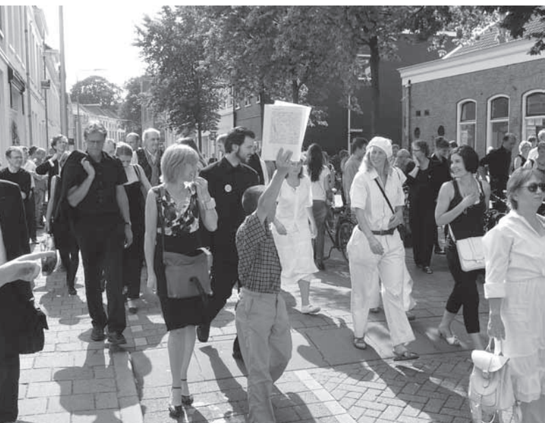
De publieksbegeleiders nemen publiek en acteurs mee naar de voorstellingen op 24 locaties in de wijk.