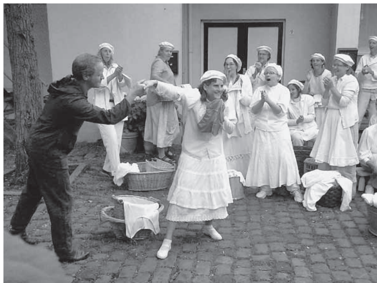
Het was al wel bekend dat het Spijkerkwartier behoorlijk wat professionele muzikanten, zangers en zangeressen, kunstenaars, conferenciers en beroepsacteurs herbergt, maar ook onder 'gewone' wijkbewoners blijkt er heel wat talent te schuilen.