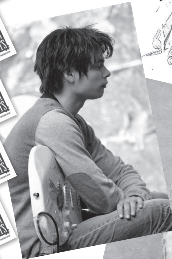
Foto's van repetitiemomenten in de Lommerd