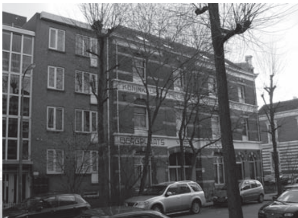
De Gruijter 2009