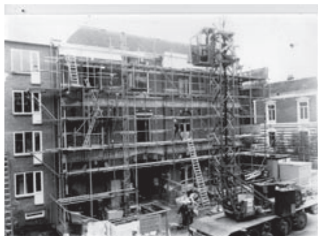
De Gruijter 1985

De Koninklijke Meubeltransport Maatschappij De Gruijter en Co. op de hoek van de Parkstraat en de Prins Hendrikstraat (foto boven, begin vorige eeuw). Ooit was hier een 'bergplaats voor inboedels', zoals bijzonder duidelijk op de gevel te lezen is. Na een periode van leegstand werd het pand in 1985 grondig onder handen genomen (foto midden) en verbouwd tot appartementen (foto onder, 2009).