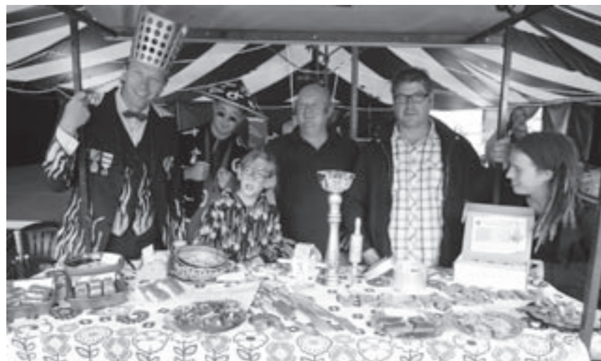
De jury achter de vrolijke koekjestafel, de inzenders hadden er een hoop werk van gemaakt.