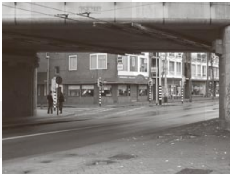
Bloemendal Optiek weg uit de Steenstraat.