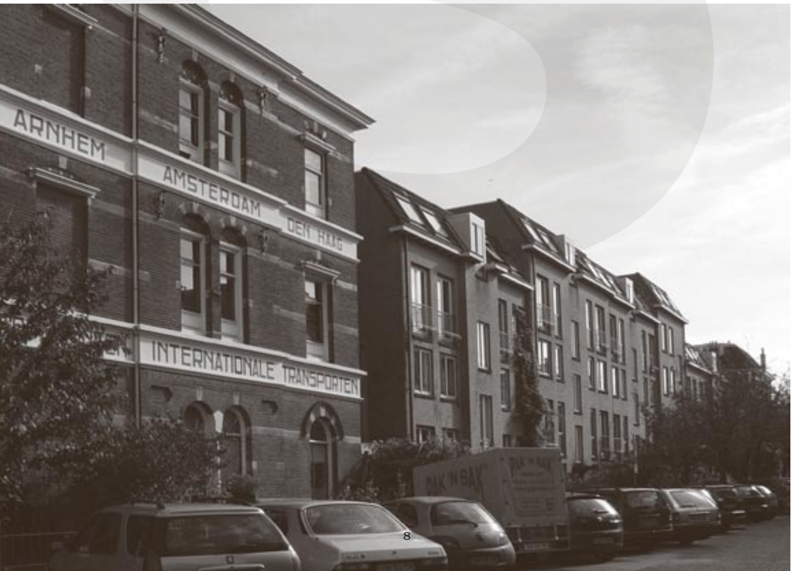
Foto onder: Prins Hendrikstraat 2008