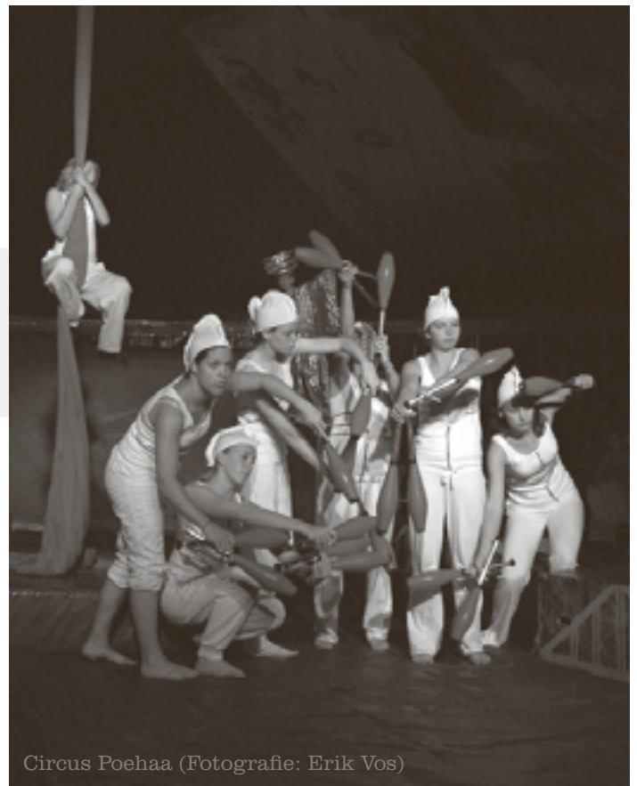
Circus Poehaa

Van verdere ontwikkelingen houden we u op de hoogte.