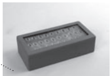
Ton de Vreede