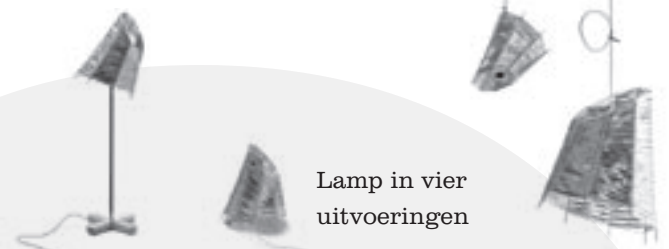
Lamp in vier uitvoeringen