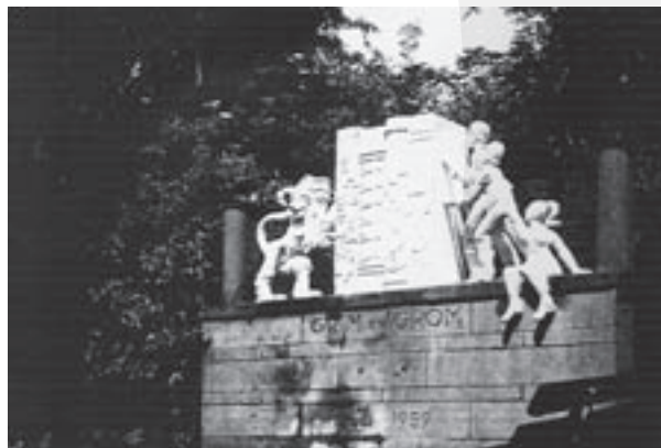
Het monument voor Grim en Grom na de opknopbeurt in 1982.

Thorbeckestraat heeft er de provisorische rokersruimte voor de gymnasiasten maar voor gezet om het aan het oog te onttrekken, in afwachting van betere tijden voor wat ons nog rest van het monument voor Grim en Grom. De komst van het Gymnasium naar het gebouw luidt ook een nieuwe periode in. Als we erin slagen het monument te behouden is dat de uitgelezen plek waar het verhaal van Grim en Grom en de HBS aan het Willemsplein, de Thorbecke Scholengemeenschap en het Stedelijk Gymnasium verteld kan worden.