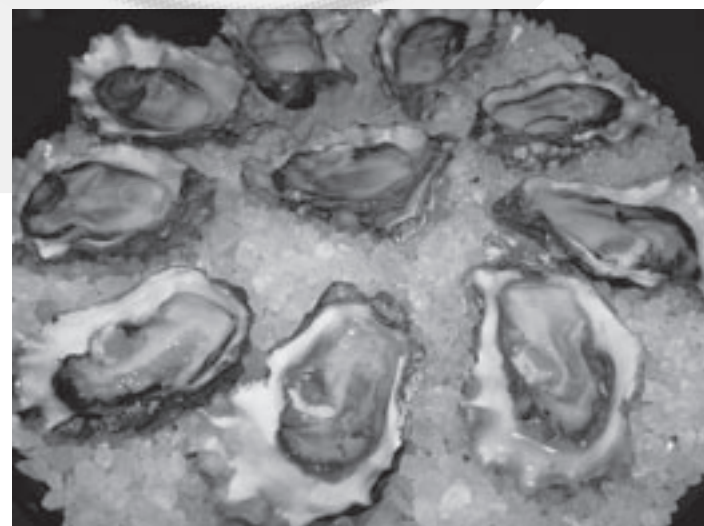
Verse oesters op ijs

Nogmaals een oproep aan... uzelf! Bedenk altijd dat het geheime ingrediënt Liefde is!