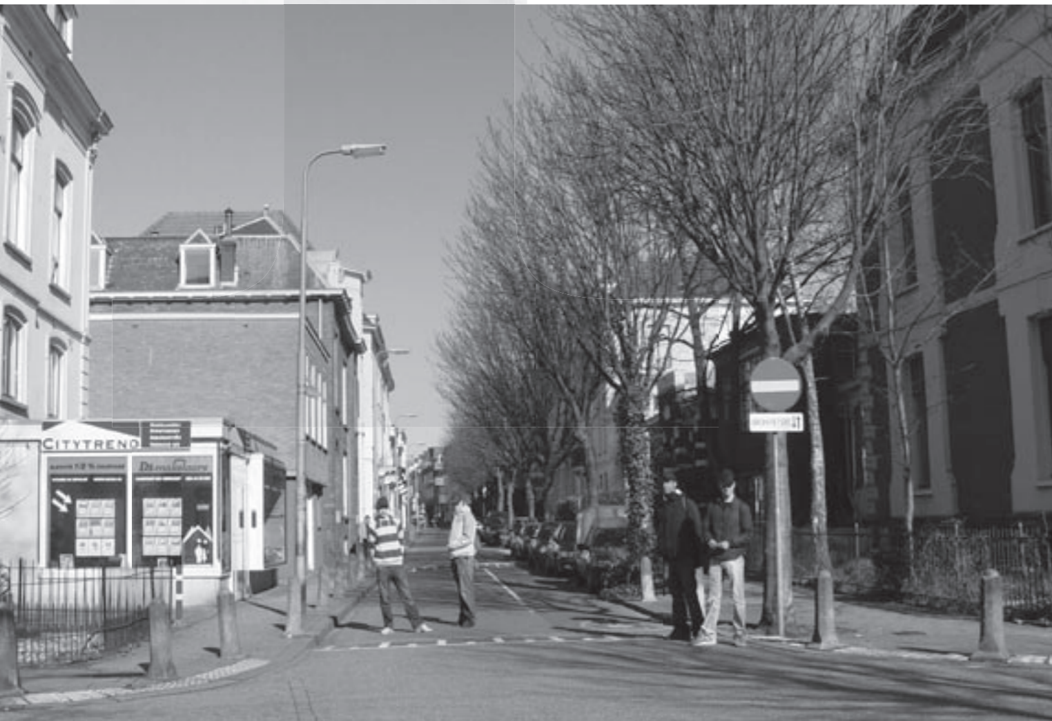
foto boven: begin 20e eeuw, foto onder: maart 2007