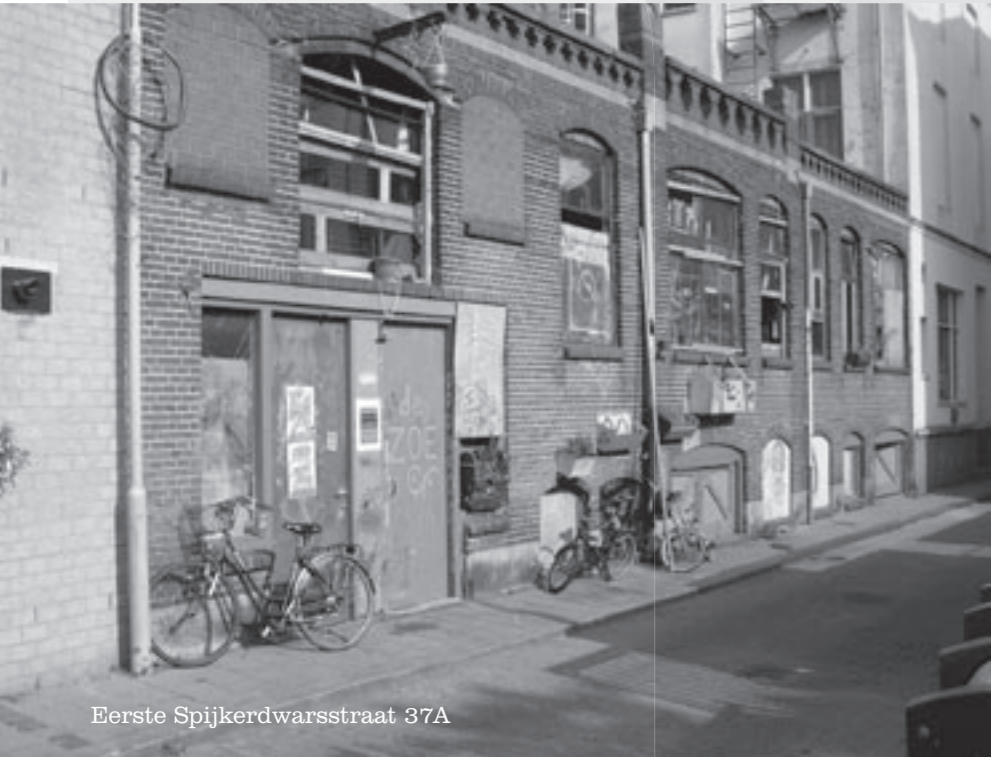
Eerste Spijkerdwarstraat 37A

Het pand heeft wel iets van een juttersmuseum, zoals je die op de waddeneilanden vindt. Met dit verschil: de collectie is niet op het strand bijeengezocht, maar in de stad. Het souterrain, dat dienst doet als opslagruimte, en de eerste etage, waar zich de keuken en de woonkamer bevinden, zijn volgestouwd met objets trouvés: allerhande gebruiksartikelen die de bewoners op straat hebben gevonden.