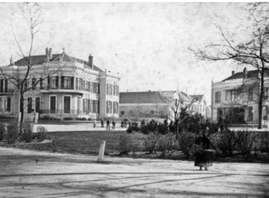
Velperplein, 1880: links de plek waar nu het Rembrandttheater staat, in het midden het begin van de Spoorwegstraat

Binnenkort sluit het Rembrandttheater aan het Velperplein zijn deuren als Pathé-bioscoop. Hopelijk is dat het begin van een nieuwe toekomst voor het markante gebouw. Reden genoeg om de geschiedenis te reconstrueren, met herinneringen van (oud-) bewoners van de Spoorhoek die zijn vastgelegd in Het Spoorboekje.