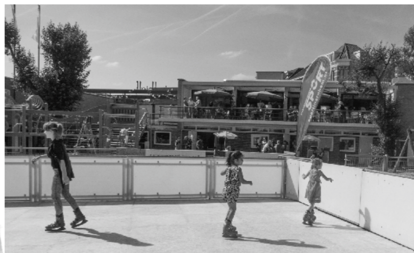
Net als 100 jaar geleden kon er weer even geschaatst worden op Thialf.