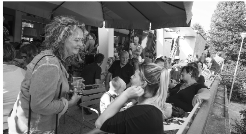
Op het terras van de brasserie leek de vakantie al echt begonnen