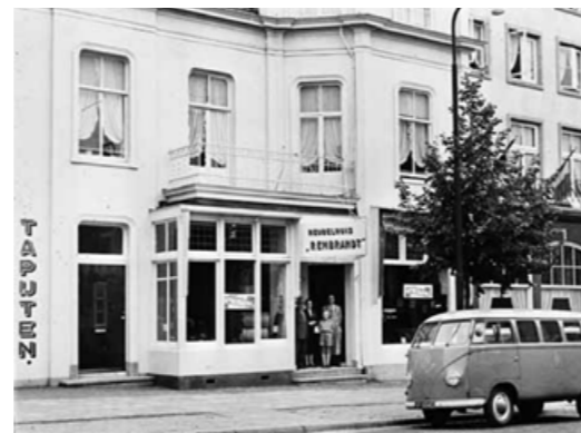
Apeldoornsestraat 6, jaren vijftig: Meubelhuis Rembrandt