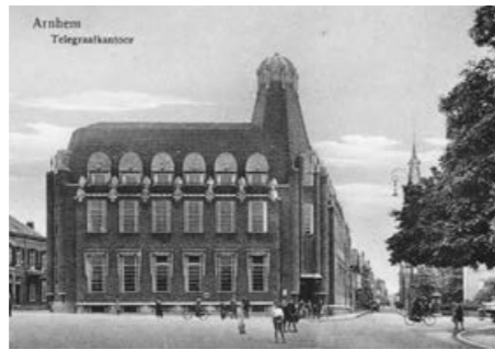
Telegraafkantoor aan het Velperplein tussen de Patersstraat (links) en de Spoorwegstraat (rechts).