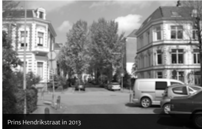
Prins Hendrikstraat in 2013