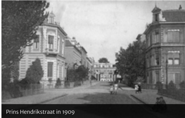
Prins Hendrikstraat in 1909