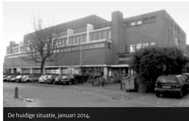
De huidige situatie, januari 2014.