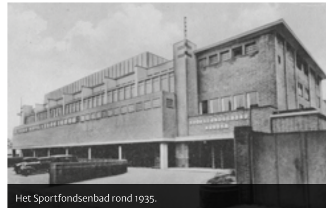
Het Sportfondsenbad rond 1935.

De huidige gebruiker van het pand is sinds 1996 "Indoor Action". Het zwembad is inmiddels gedicht en dit is de ruimte waar nu de groepslessen worden gegeven en de fitnessapparatuur staat. Onder het zwembad is nog een fitness- en cardioruimte (bron: website Indoor Action). Wanneer je nu het pand binnenkomt zie je de ruimte, die vroeger onder het bad lag; het was de machinekamer met pompen en filters en waar de verwarmingsinstallatie te vinden was. Aan de zijkant van het gebouw staat nog de schoorsteen van het verwarmingssysteem van die tijd.