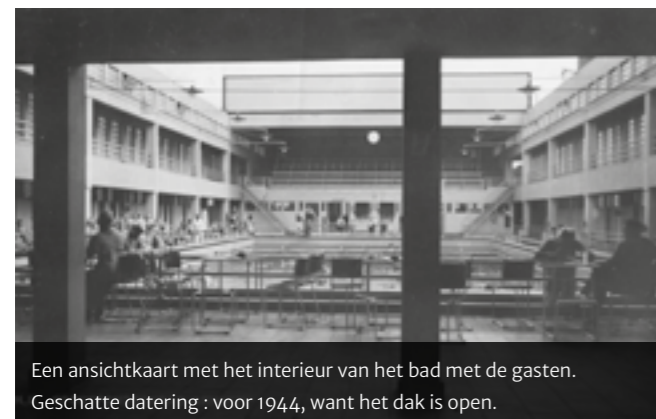
Een Ansichtkaart met het interieur van het bad met de gasten. Geschatte datering: voor 1944, want het dak is open.