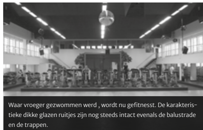
Waar vroeger gezwommen werd, wordt nu gefitnesst. De karakteristieke dikke glazen ruitjes zijn nog steeds intact evenals de balustrade en de trappen.