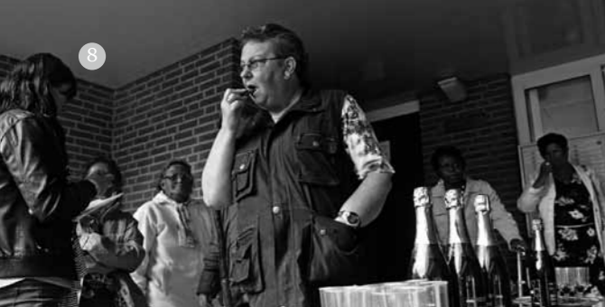
< Spoorhoek bezoekers worden rijkelijk getracteerd op een glas bubbels