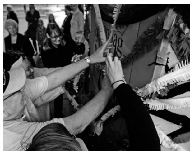
Bewoners van de seniorenflat De Tuinpoort onthullen onderdeel van het kunstwerk >