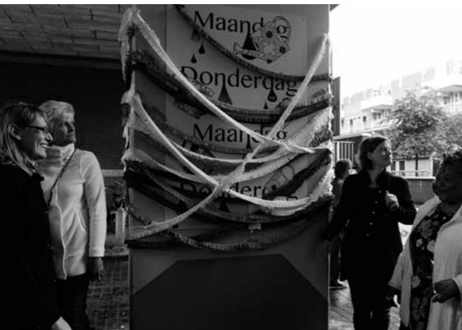
< Spoorhoek bewoners staan in de startblokken om het kunstwerk te onthullen