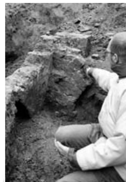
Oude boogmuren tussen de betonnen poeren van de gesloopte Dullertflat