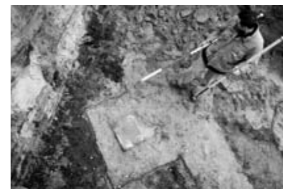
Resten van de fundering van het Dullert Spijker onder de gesloopte Dullertflat