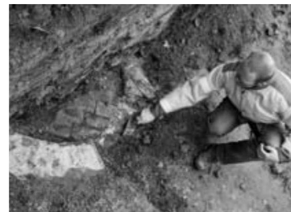
Links: De bodem van een waterput wordt zichtbaar