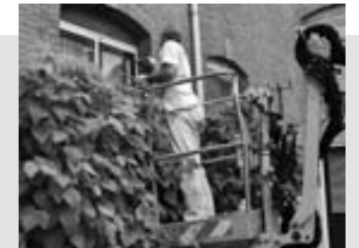
Een schilder wringt zich door de beplanting