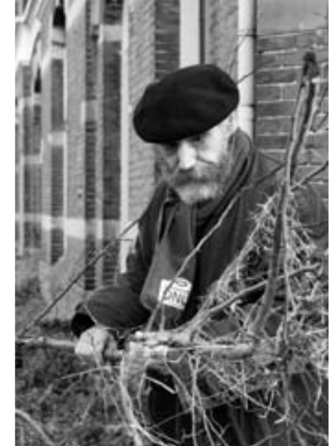
Kassiël toont de afgebroken takken

Hieronder de brief die hij de redactie van de wijkkrant stuurde.