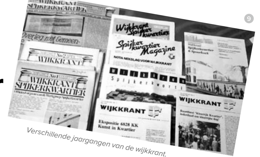
Verschillende jaargangen van de wijkkrant.

Van de recente jaargangen, die digitaal zijn opgemaakt, zijn de pdf edities reeds te vinden op www.spijkerkwartier.net onder archief wijkkrant.