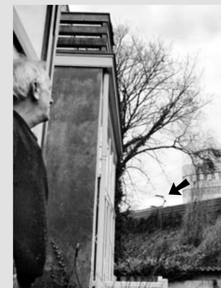
Steven kijkt vanaf de veranda naar een voorbijrijdende trein (zie pijltje).

De wijkkrant is benieuwd naar uw verhaal. E-mail redactie@dewijkkrant.nl