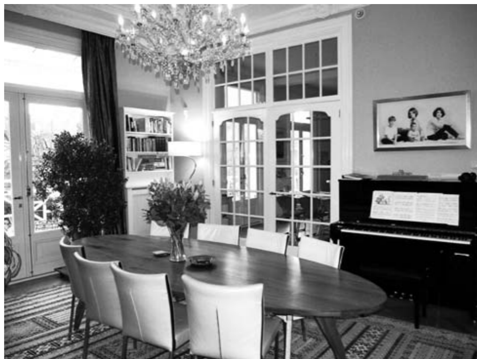
De eetkamer met grote familietafel aangrenzend aan de ruime keuken.