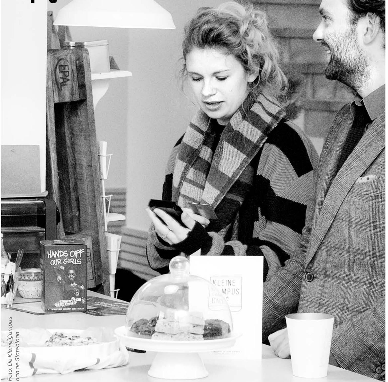
Foto: De Kleine Campus aan de Statenlaan