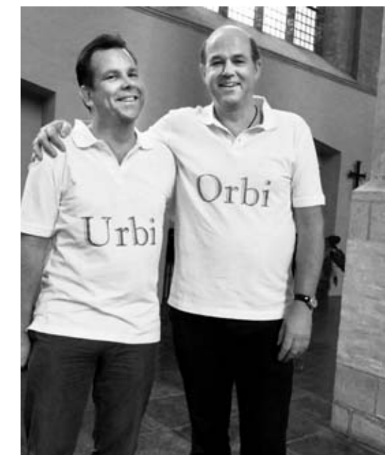
Ad (Urbi) en Han (Orbi).

Wil je meer weten of meehelpen ga dan langs bij het SpA aan de Driekoningendwarstraat 30 of kijk op: www.stadspastoraatarnhem.nl