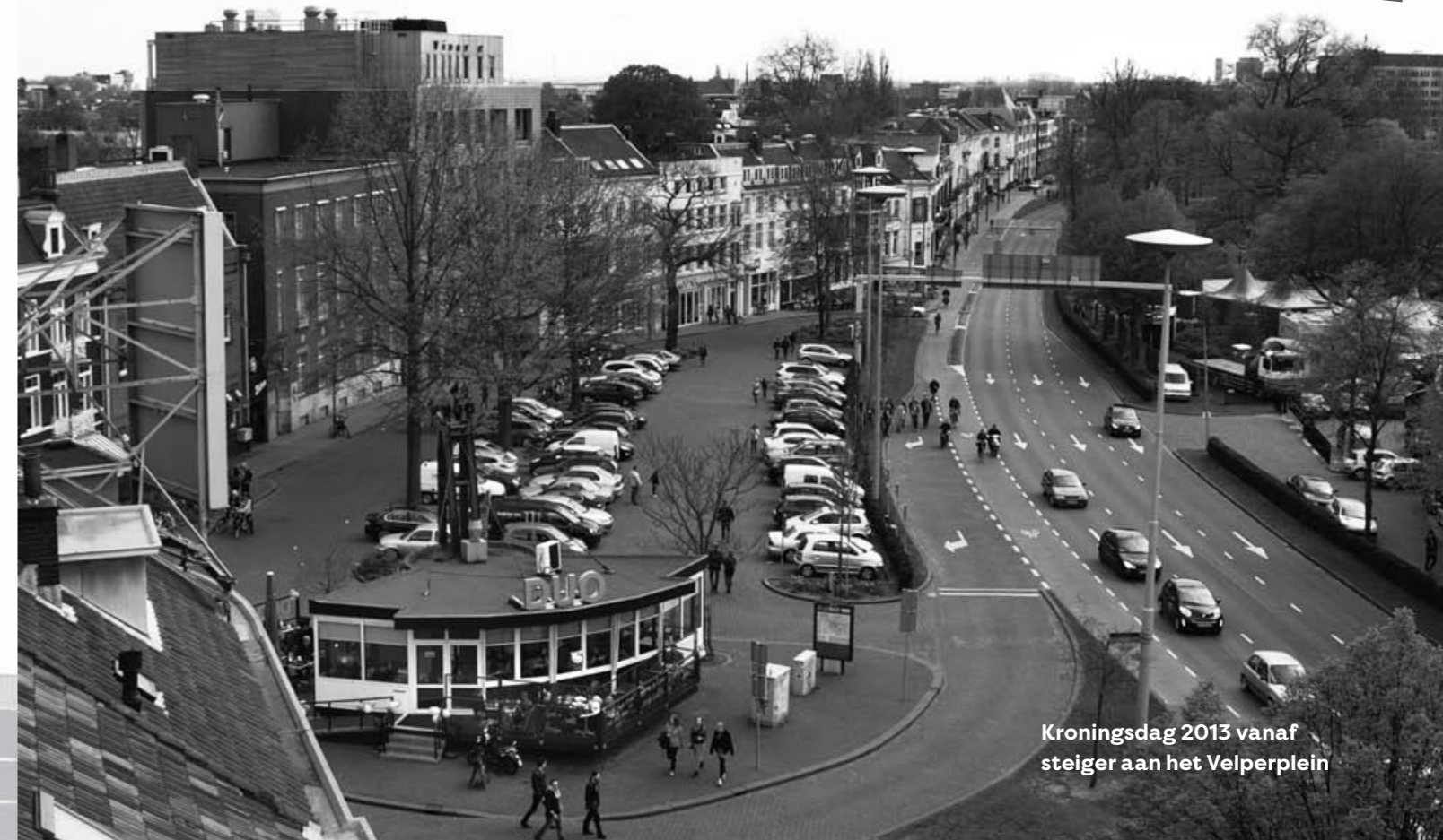
Kroningsdag 2013 vanaf steiger aan het Velperplein