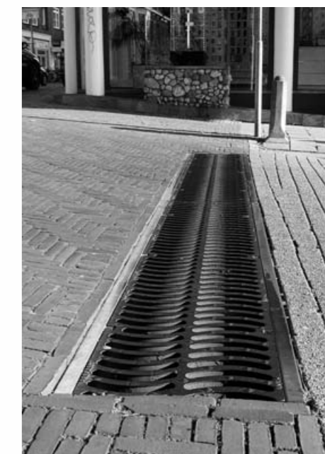
Straatcolk in de Steenstraat

gemaakt, gebaseerd op de meldingen die zijn binnengekomen. Bewoners van de wijk worden betrokken bij het compleet maken van deze inventarisatie; in januari zal een bijeenkomst worden georganiseerd om van bewoners zelf te horen wat de problemen zijn. Een vooroverleg met vertegenwoordigers van de wijkorganisaties is inmiddels gepland. Na de inventarisatie wordt een analyse gemaakt en worden er prioriteiten gesteld op grond van noodzaak en kosten. Eind maart gaat alle informatie naar de gemeenteraad die dan een beslissing neemt over het vervolgtraject.