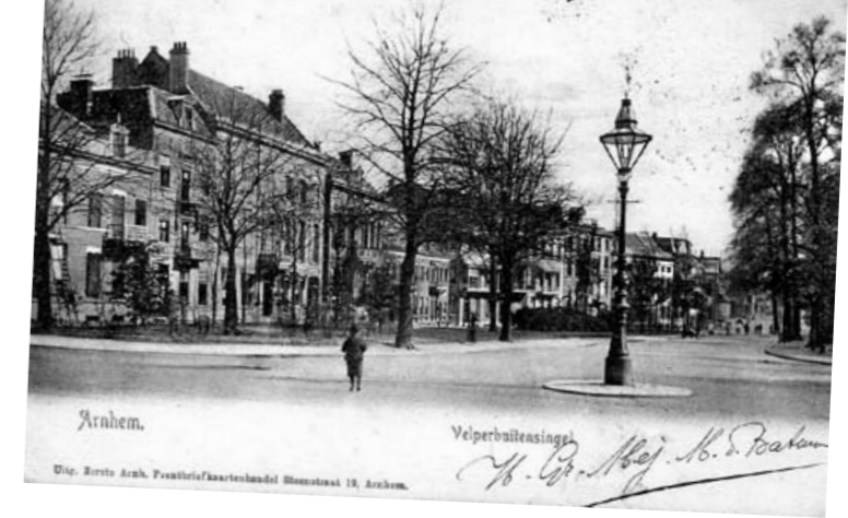
Ansichtkaart uit 1905

Door Ben Bongers Velperbuitensingel. in de vorige wijkkrant vanuit zuidoosten, nu vanuit het noordwesten.