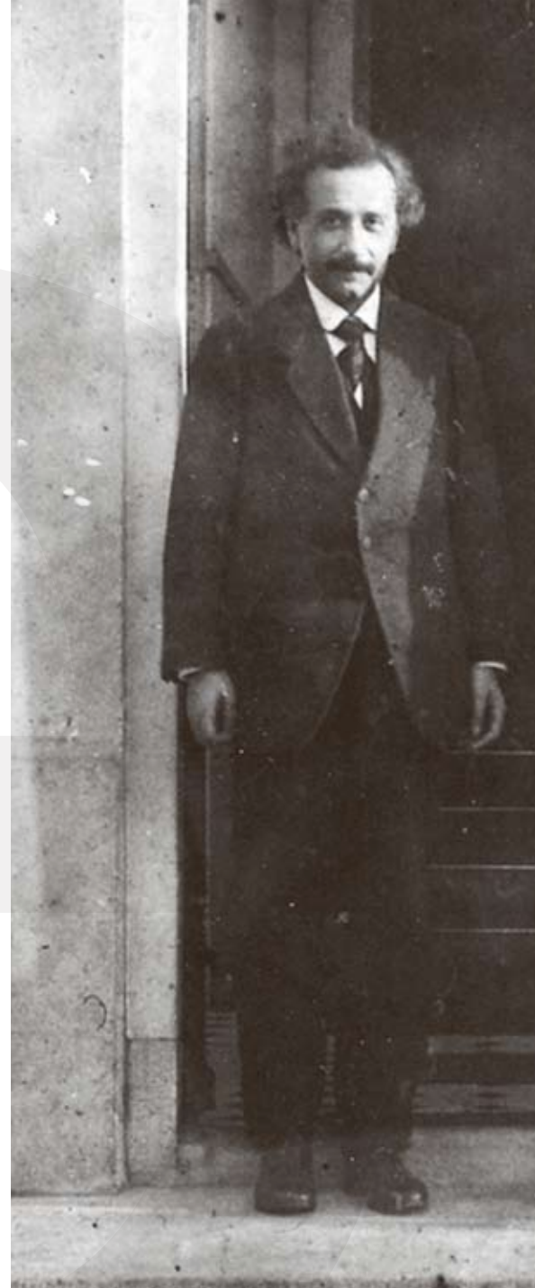
Einstein en Lorentz

Meester Timmer wekt met zijn natuurkundeproeven de eerste interesse bij Hendrik voor de wetenschap, die in de negentiende eeuw een stormachtige ontwikkeling doormaakt.